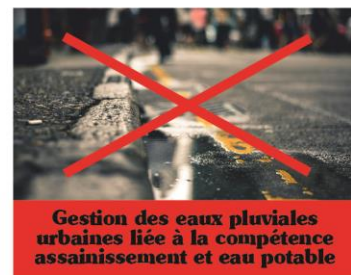
Gestion des eaux pluviales urbaines liée à la compétence assainissement et eau potable