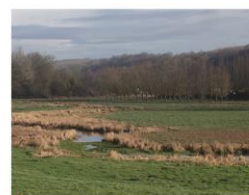
Protection et restauration des sites, écosystèmes aquatiques et zones humides