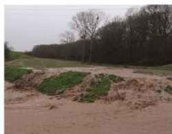
Gestion des ruissellements

Le propriétaire riverain, au travers de son ASA lorsqu'elle existe, reste responsable de l'entretien du cours d'eau.