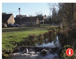
Entretien et aménagement des cours d'eau