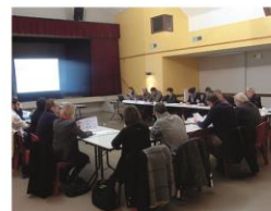
Animation des Politiques de l'Eau