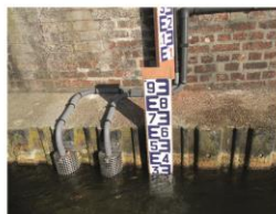
Exploitation de dispositifs de surveillance