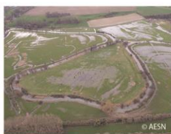
Aménagement des bassins versants